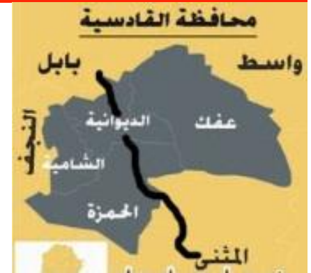
خطوط راه آهن بغداد - قادسيه