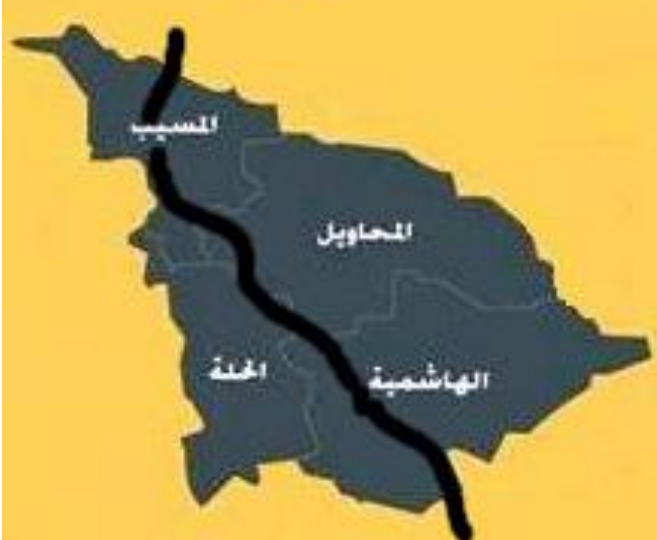
خطوط راه آهن بغداد - حله